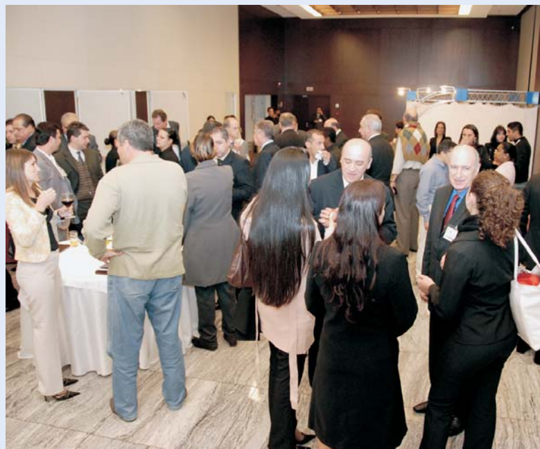
Associados, palestrantes e convidados se confraternizam no coquetel de encerramento