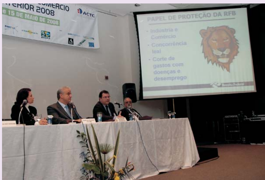
Ao fundo, o leão da Receita Federal